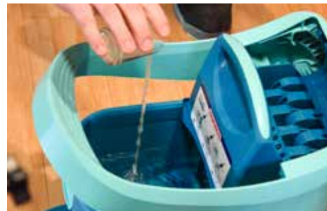
MISCHVERHÄLTNIS SEIFE UND WASSER BEACHTEN.