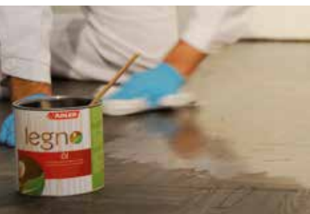
VORGANG MIT LEGNO-ÖL ODER -HARTWACHSÖL WIEDERHOLEN