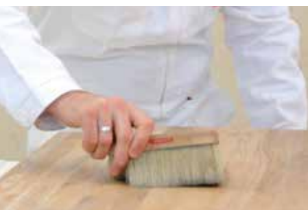
STAUB UND SCHMUTZ ENTFERNEN