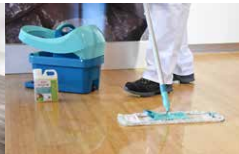
BODEN MIT DEM SEIFENWASSER WISCHEN – KEINE PFÜTZEN STEHEN LASSEN!